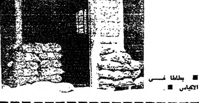
بطلان نسي الكياس

زحلة - من مكتب «الانوار» الزحليون يرفعون الصوت هذه الايام ضد موجة الغلاء التي جناح معظم اسواق المدينة، خاصة اسواق الخضار. مثال على ذلك ارتفاع سعر كيلو البندورة الى 8 ليرات في الوقت الذي لم يتجاوز 3 ليرات في عز الكفاح الماضي. حتى البصل، من البقال، صار سعره 10. قرشا والنول 20. قرشا، ومثلها كسل الخضار التي يتكرر الزحليون من استهلاكها في ايام كهذه، ايام الصوم. خاصة اصحاب مجال للتشوي.